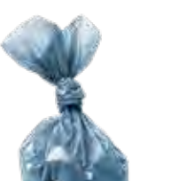
Rác Thải từ Vật Nuôi