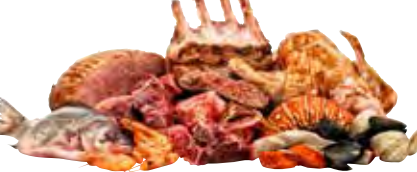
Thịt, Cá và Gia Cầm