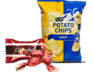
Giấy Gói Kẹo, Đồ Ăn Nhẹ và Thực Phẩm