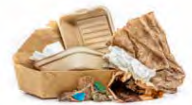
Giấy Dính Thức Ăn, Giấy Lọc Cà Phê và Túi Trà