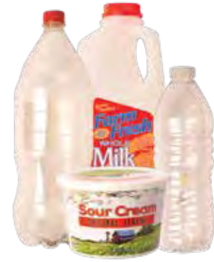
Chai và Hộp Nhựa