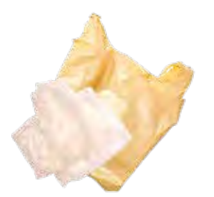
Túi Nhựa và Màn Bọc Nhựa