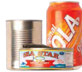
Lon/Hộp Thực Phẩm và Đồ Uống