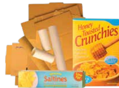
Thùng Các-tông Đã Gập Bẹp và Bìa Giấy