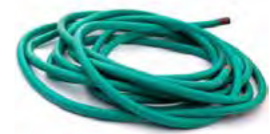
Ống Nước Tưới Vườn