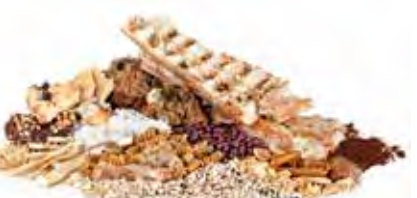
Bánh Mì, Mì Pasta, Cơm, Ngũ Cốc, Bã Cà Phê

Cho trực tiếp rác thải hữu cơ vào thùng rác hữu cơ hoặc cho rác thải hữu cơ vào túi phân hủy sinh học và cho túi đó vào thùng rác hữu cơ.