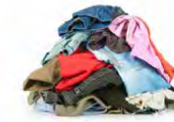
Quần Áo và Vải Vóc