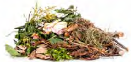
Rác Thải Sân Vườn