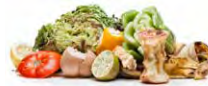
Rác Thải Thực Phẩm