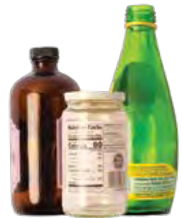
Chai và Hộp Thủy Tinh