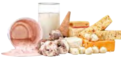
Sản Phẩm Từ Sữa