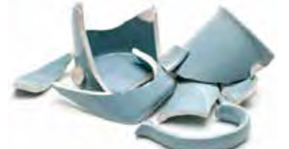
Bát Đĩa và Nồi Chảo Sứ Vỡ