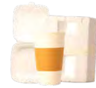
Cốc và Hộp Xốp